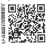
入居者向け携帯サイト

☎ 03-6863-3964 受付時間: 10:00~17:30 (土日祝日を除く平日) ☐ http://www.casa-inc.co.jp